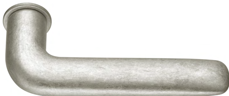
FSB 1292 in der gleitgeschliffenen Oberflächen-Ausführung 0013