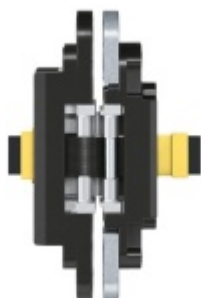
Tectus 340 3D Energy s průchodkou, pro bezfalcové dveře