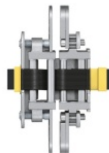
Tectus 526 3D Energy s průchodkou, pro bezfalcové dveře