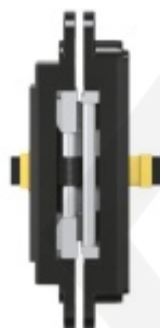
Tectus 640 3D Energy s průchodkou, pro bezfalcové dveře