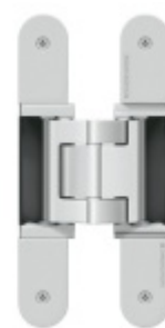
Tectus 540 3D A8 - skrytý pant pro bezfalcové dveře s obkladem