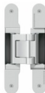
Tectus 541 3D FVZ- skrytý pant, skrytá zárubeň