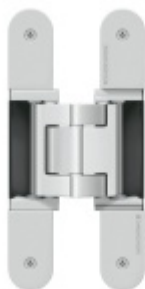
Tectus 540 3D A8 - skrytý pant pro bezfalcové dveře s obkladem