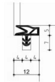
Dveřní těsnění Deventer pro bezfalcové dveře