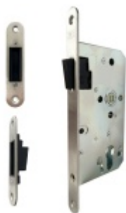
Magnetický zámek EFB, stavitelný protiplech nerez