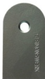
Náhradní krytka Tectus 340