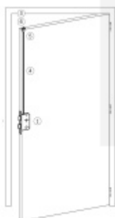
Stranové určení zámků SSF