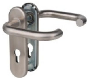
Štítkové kování Südmetall Paula-KS