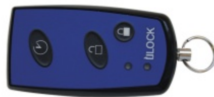
Dálkový ovladač ÜLOCK