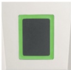
ÜControl RFID - čtečka, kabelová