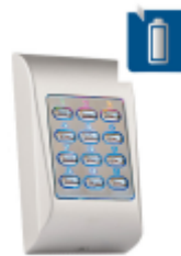
Klávesnice Ülock battery