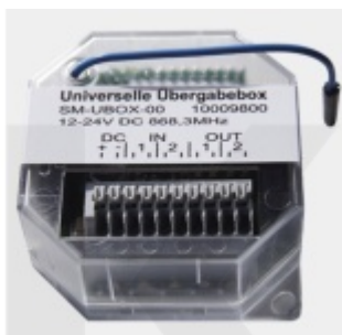
Ülock I/O modul - interface pro komunikaci se systémy jiných výrobců