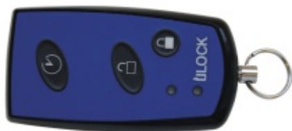
Dálkový ovladač ÜLOCK