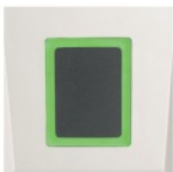
ÜControl RFID - čtečka, kabelová