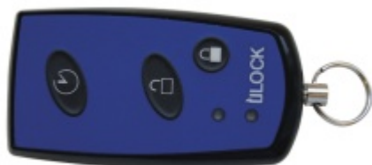
Dálkový ovladač ÜLOCK