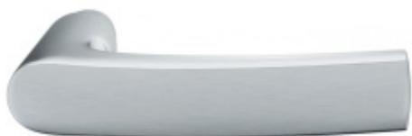
FSB ASL 10 1015 samostatná dveřní klika