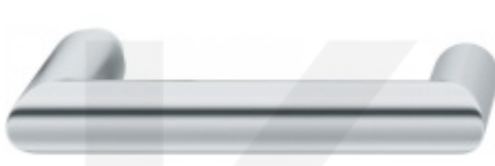
FSB ASL 10 1016 samostatná dveřní klika