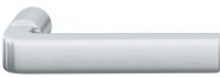
FSB ASL 10 1004 samostatná dveřní klika