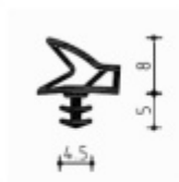
Dveřní těsnění Deventer pro bezfalcové dveře