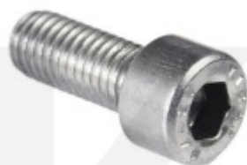
Šroub pro montáž držáku skla