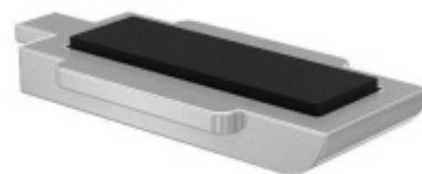
Spodní koncovka předsazeného držáku