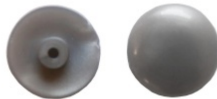
Krytka pro držáky na sklo