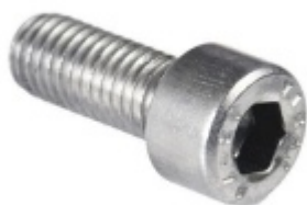
Šroub pro montáž držáku skla