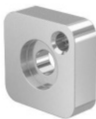
Adaptér předsazeného držáku, na plochu