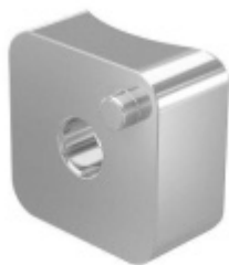
Adaptér předsazeného držáku, pro trubku