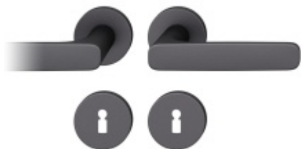
Kování FSB 12 1289 ASL