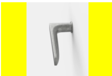
FSB 15 1289 Plug-in