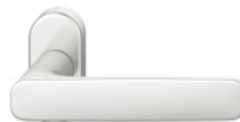
FSB 09 1289, klika na úzké rozetě