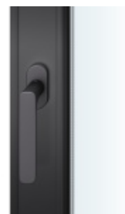
FSB 34 1289, okenní klika