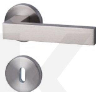
Südmetail Canto-R, nerez vzhled, 4. objektová třída