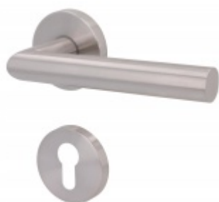
Südmetail, Ronny II-R, 20 mm, TopSpeed