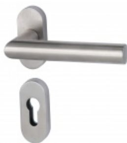
Klika s úzkou rozetou Südmetail Ronny II-R, TopSpeed