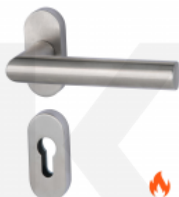
Klika s úzkou rozetou Südmetail Ronny II-R, TopSpeed, požární