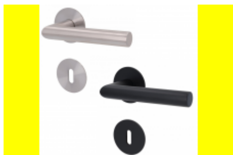
Südmetail München -R, nízká rozeta magnetická