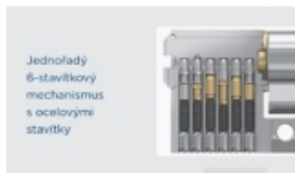
Jednořadý 6-stavítkový mechanismus s ocelovými stavítky