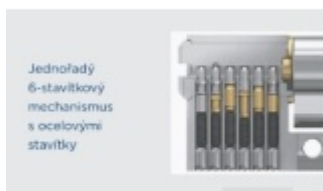
Jednořadý 6-stavítkový mechanismus s ocelovými stavítky