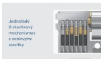
Jednořadý 6-stavítkový mechanismus s ocelovými stavítky