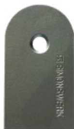
Náhradní krytka Tectus 340