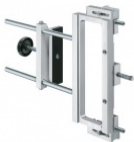
Univerzální frézovací rám Simonswerk