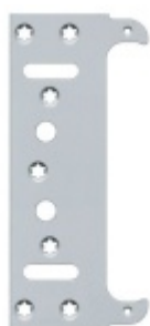
Tectus 240 3D FZ - upevňovací deska pro obložkovou zárubeň