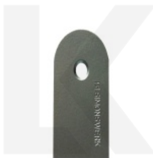
Náhradní krytka Tectus 240 (stříbrná/černá)