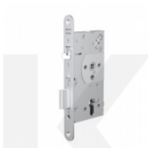
Assa ABLOY EL561 - Elektromechanický samozamykací dveřní zámek, široký - oboustranná kontrola vstupu