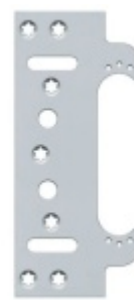
Tectus 311 3D FVZ FZ/1 - upevňovací deska pro obložkovou zárubeň