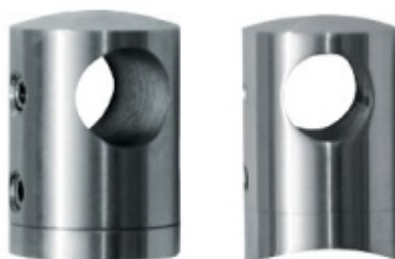
Držák tyče pro zábradlí