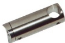
Držák tyče pro zábradlí, odsazený