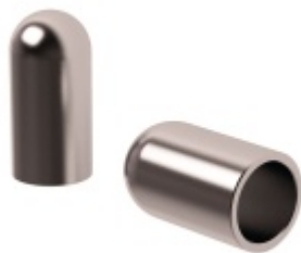
Koncovka na trubku, nerez