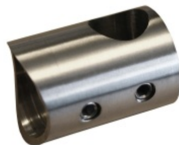
Koncovka tyče pro zábradlí