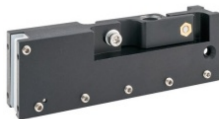
VERTO VT 100E20 - pivotový pant, horní díl