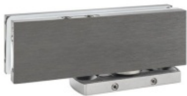
VERTO VT 101E10 - pivotový pant s aretací