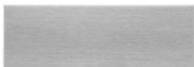
VERTO VT100E20 C - kryt pivotových pantů