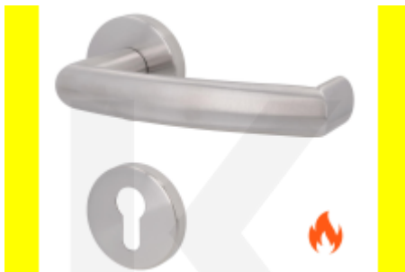
Südmetail Katy II-R, EN 179, TopSpeed