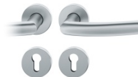
Kování FSB 12 1107 ASL