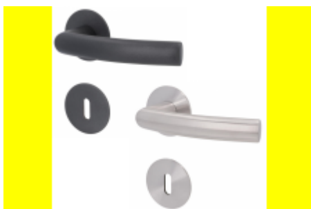
Südmetail Bochum - R, nízká rozeta magnetická