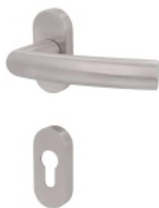
Klika s úzkou rozetou Südmetail Katy II-R