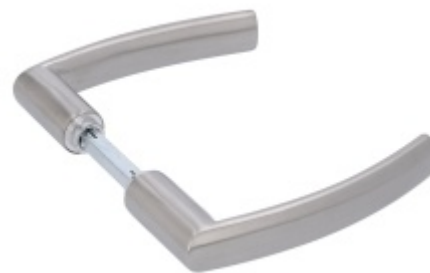
Klika ke kování pro skleněné dveře Südmetail Katy