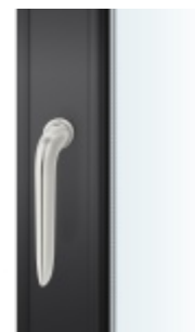
FSB 34 1292 71, okenní klika Plug-in