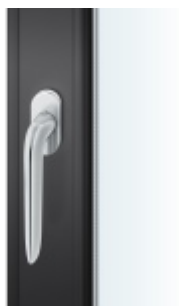
FSB 34 1292, okenní klika