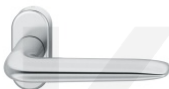
FSB 09 1292, Klika na úzké rozetě