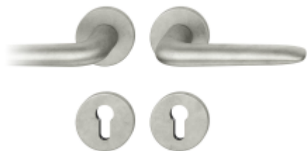
Kování FSB 12 1292 ASL Pure Aluminium