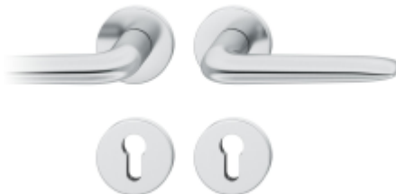
Kování FSB 12 1292 ASL