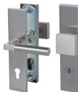
Südmetail Alaska Square Nerez, bezpečnostní kování