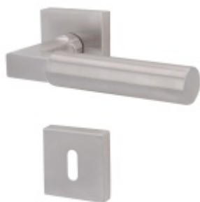
Südmetail Alaska Quadro-R, TopSpeed