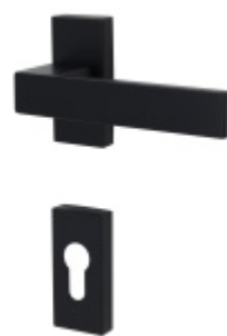
Klika s úzkou hranatou rozetou Südmetall Matteo-R, TopSpeed, černá