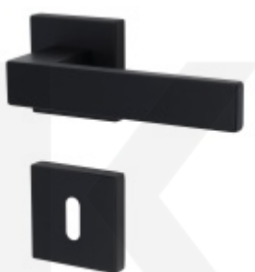
Südmetall Matteo Quadro-R Black, TopSpeed