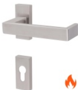
Klika s úzkou rozetou Südmetall Matteo II-R, paniková