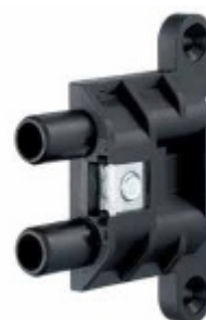
Simonswerk Variant V 3630