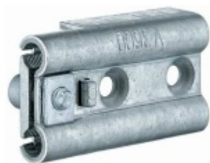
Simonswerk Variant V 3600