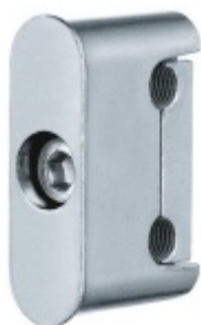
Simonswerk Variant V 3604