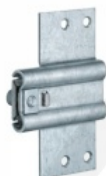
Simonswerk Variant V 3611