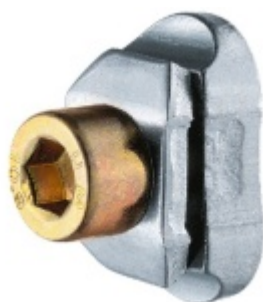
Simonswerk Variant V 3605