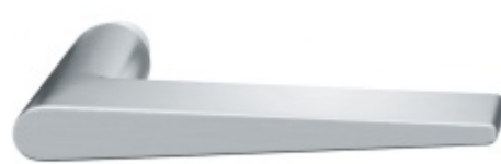
FSB ASL 10 1005 samostatná dveřní klika