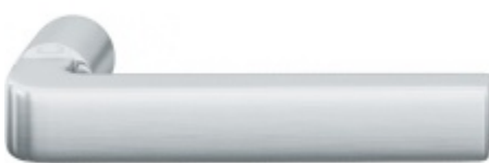
FSB ASL 10 1004 samostatná dveřní klika