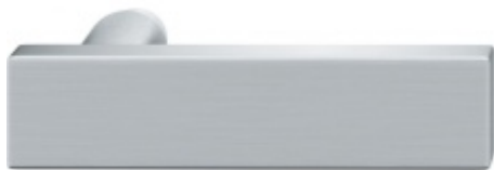
FSB ASL 10 1003 samostatná dveřní klika