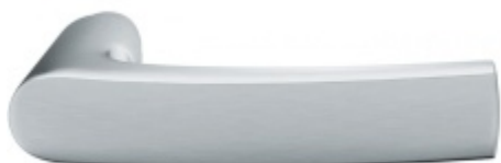
FSB ASL 10 1015 samostatná dveřní klika