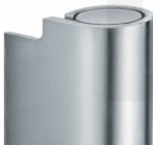
Povrch matný chrom