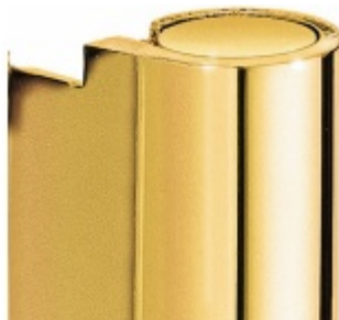
Povrch leštěná mosaz