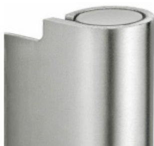
Povrch matný nikel