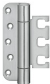
Simonswerk Variant VX 7728/120