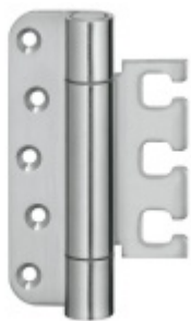
Simonswerk Variant VX 7728/120