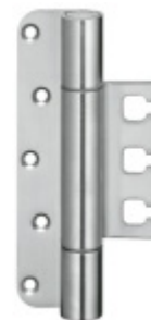
Simonswerk Variant VX 7728/160