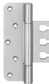
Simonswerk Variant VX 7729/160 Planum