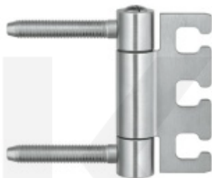
Simonswerk Variant VX 7720/100