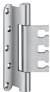
Simonswerk Variant VX 7939/160 Planum