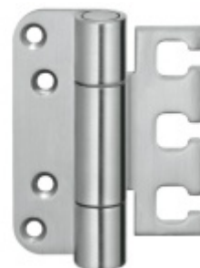
Simonswerk Variant VX 7728/100