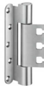
Simonswerk Variant VX 7939/160