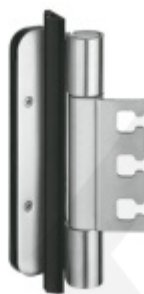
Simonswerk Variant VX 7939/160-4 FD VBRplus