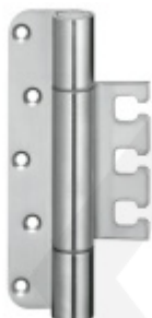
Simonswerk Variant VX 7728/160