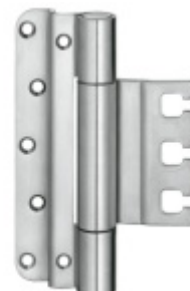
Simonswerk Variant VX 7859/160