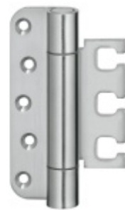
Simonswerk Variant VX 7728/120