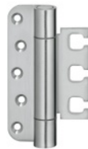
Simonswerk Variant VX 7728/120