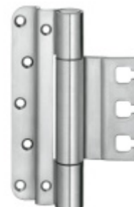
Simonswerk Variant VX 7859/160