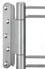
Simonswerk Variant VN 3938/160