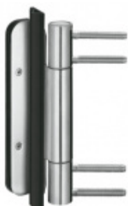
Simonswerk Variant VN 3938/160 FD