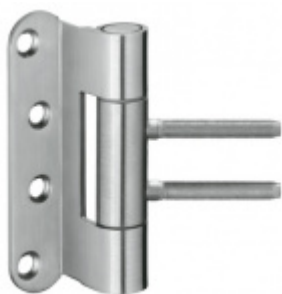
Simonswerk Variant VN 3939/100