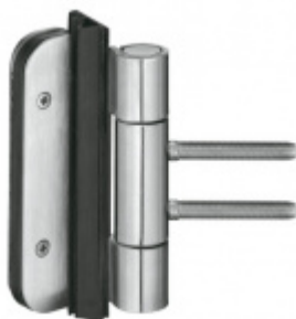
Simonswerk Variant VN 3939/100 FD