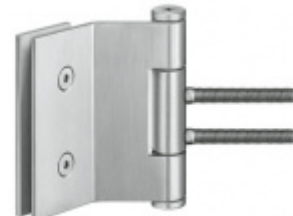
Simonswerk Variant VG 3990 K