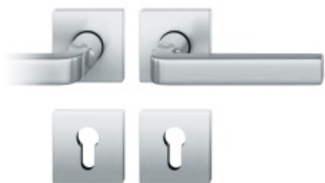
Kování FSB 76 1004 požární