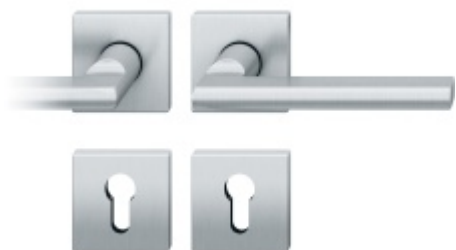
Kování FSB 76 1035 požární