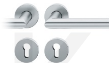
Kování FSB 76 1076 požární