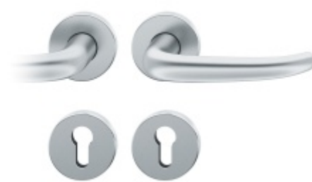
Kování FSB 76 1023 požární