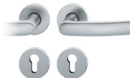
Kování FSB 76 1015 požární