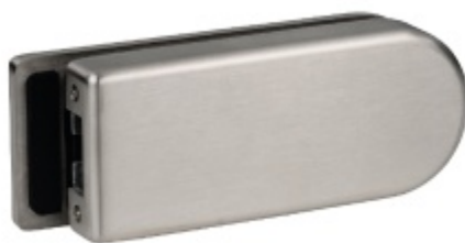
Protikus ke štítku Valencia GK long