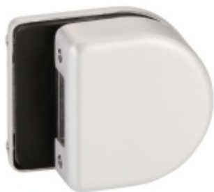
Protikus ke štítku Valencia GK short