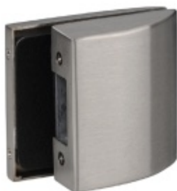
Protikus ke štítku Malaga GK short