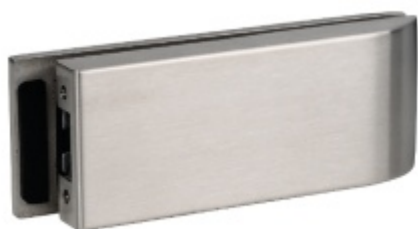
Protikus ke štítku Malaga GK long