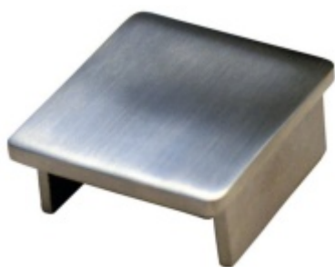
Koncovka pro nerezové zábradlí hranaté